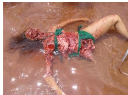
Extrait d'un film des studios de Hollywood

Pour commencer, il faut savoir qu'il n'y a eu qu'une seule attaque mortelle envers les hommes de la part des piranhas. C'était en 1870, le Brésil était alors en guerre contre le Paraguay. Des soldats blessés, saignant alors abondamment ont essayé de franchir le Rio Paraguay, mais ils seront dévorés vivants. Il n'y a pas eu d'autres attaques vérifiées de piranhas ayant entraîné mort d'hommes. Par contre, le piranha aime les cadavres et s'attaque donc à tous les corps tombés ou jetés dans l'eau, mais ils ne sont pas la cause du décès qui est souvent la noyade ou un meurtre. La réputation de tueur d'hommes est donc infondée.