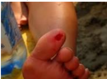
Morsure d'un piranha

Même s'il mord de temps à autre un pêcheur qui se lave les mains dans l'eau, ce poisson n'est donc pas une menace pour l'homme, d'autant plus que son aire de répartition abrite des créatures bien plus redoutables les caïmans, les raies venimeuses les anguilles électriques, etc. N'en concluez pas cependant que ce poisson est un ange car il serait risqué de traverser une pièce d'eau isolée infestée de ces créatures en période