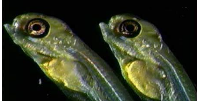
Jeunes piranhas rouges ( Pygocentrus nattereri )

sur les œufs déposés au sein de la végétation aquatique. La reproduction a lieu en général de février à mai, mais cette période varie considérablement selon les régions d'Amérique du Sud. Une femelle peut pondre jusqu'à 5.000 œufs. La fécondation est très rapide, 24 heures après la ponte, la structure de base du jeune piranha est déjà constituée et il ne mettra que 4 jours pour éclore. Les parents, qui mâchent la nourriture des jeunes, montent la garde près du lit pour chasser les intrus. Malgré leur agressivité, ce sont de bons parents. A la naissance, les jeunes restent sous leur protection et ne s'éloignent pas d'eux. Les mâchoires des jeunes s'agrandissent pendant les premières semaines, rapidement elles vont s'armer de dents tranchantes.